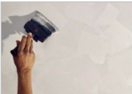
Schritt 5 - Zweiter Anstrich.