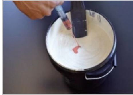
Schritt 2 - Gioia gegebenenfalls einfärben.